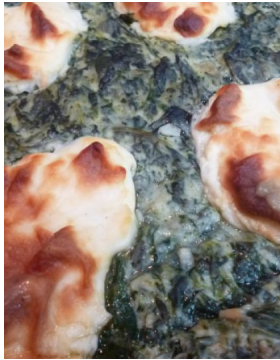
Epinard aux oeufs