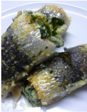
Sardines roulées à la brousse