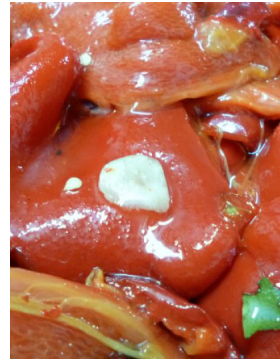
Poivrons grillés au four