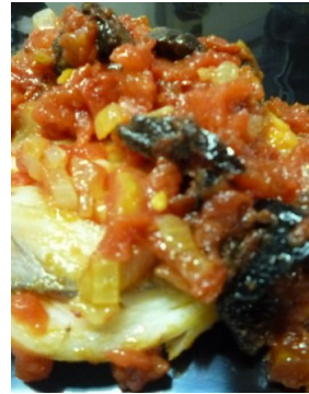
Filet d'aile de raie provençale