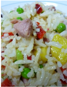
Riz jambalaya ananas