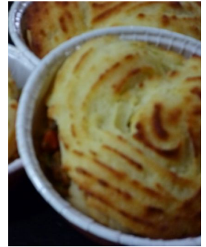
St Jacques Parmigiano