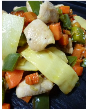
Poulet aux grésillements