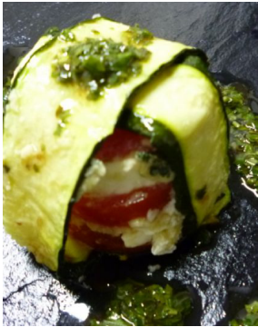
Buffala di napoli al génoise