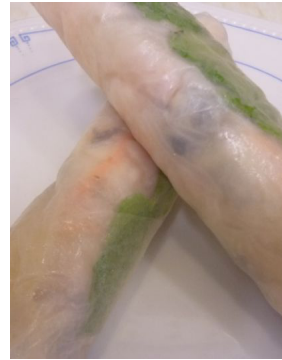
Rouleau de printemps