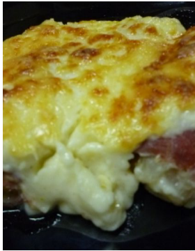
Endives au jambon