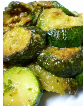
Courgette à l'indienne