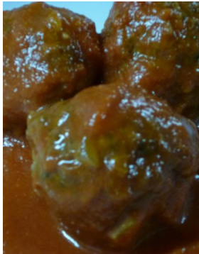
Boulettes sauce napolitaine