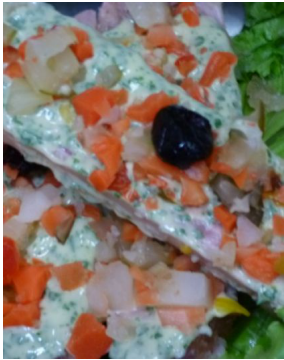
Demi pied de porc cuit persillé