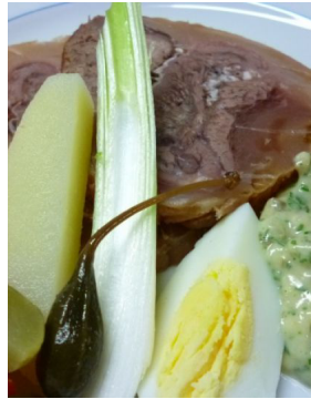
Tête de veau ravigotte