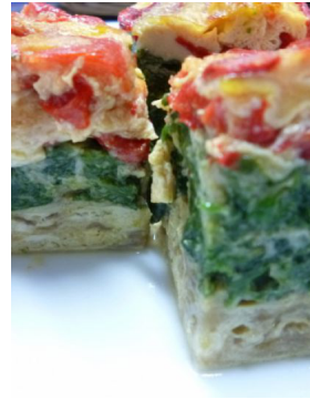
Gateau de légumes