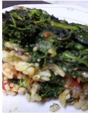
Millefeuille de sardines , épinard