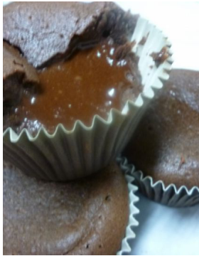
Moëlleux au chocolat