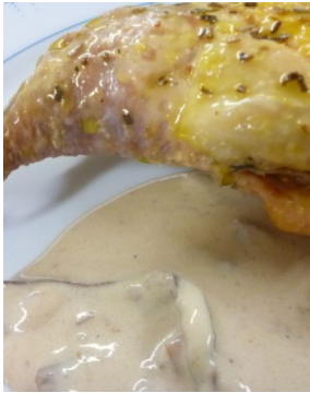
Jambonnette de pintadeau aux cèpes