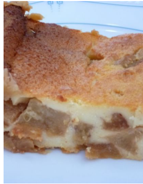
Clafoutis aux pommes