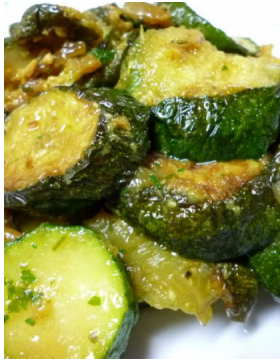
Courgette à l'indienne