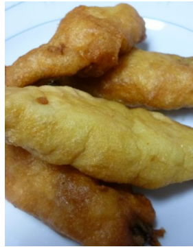
Beignet de sardines