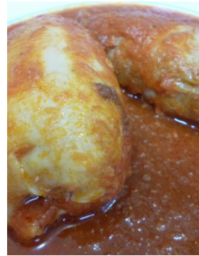
Encornet farci à l'américaine