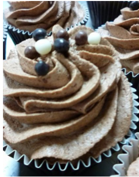
Mousse au chocolat