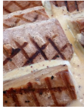
Thon sauce moutarde