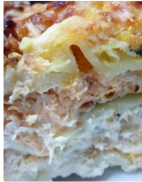
Duo de poisson en lasagne