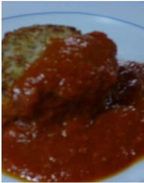
Fricandelle de veau