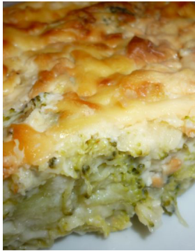
Gratin de brocolis