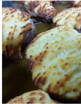
Noisette d'agneau au gratin de parmesan