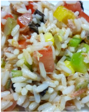
Salade de Riz