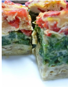
Gateau de légumes