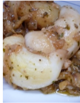
Seiche au fenouil