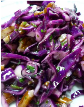
Choux rouge noix de pécan