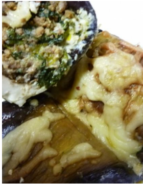
Aubergine roulée à l'orientale