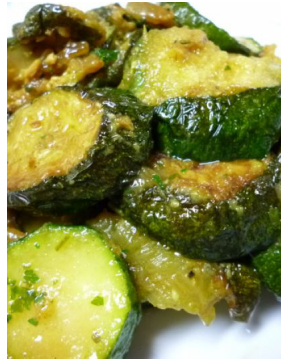
Courgette à l'indienne