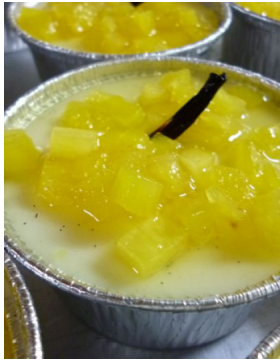
Blanc mangé Ananas