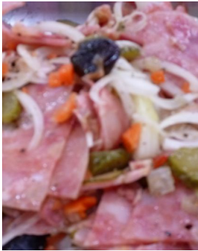
Salade de Museau