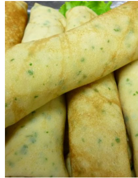
Crêpes fruit de mer