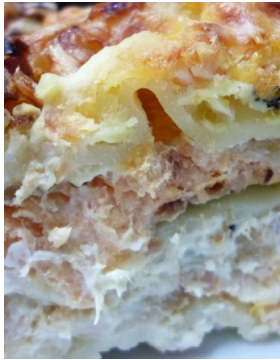
Duo de poisson en lasagne