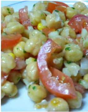
Salade de Pois chiche