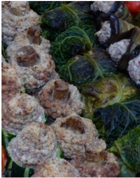
Petits farcis provençaux