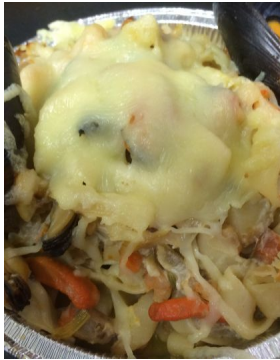
Tagliatelles aux fruits de mer