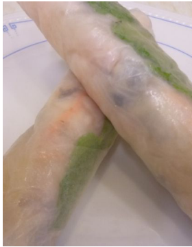
Rouleau de printemps