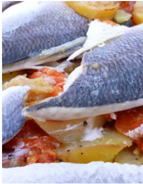
Filet de dorade au four