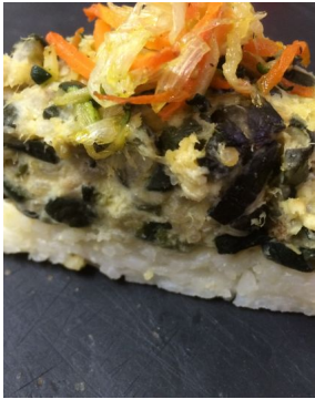
Embeurré de courgette à la badiane