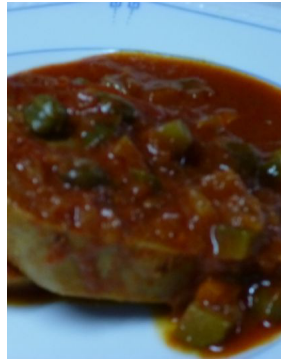
Langue de boeuf sauce capucine