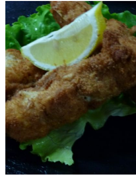
Brochette de lotte