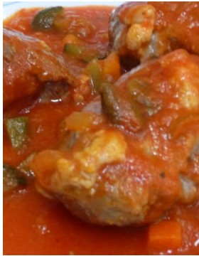
Joue de porc capucine