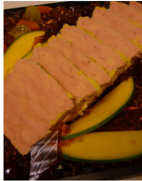
Foie gras de canard entier au Garlaban