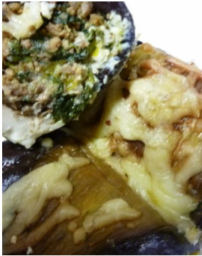
Aubergine roulée à l'orientale