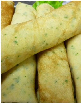
Crêpes fruit de mer