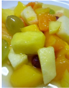
Salade de fruits