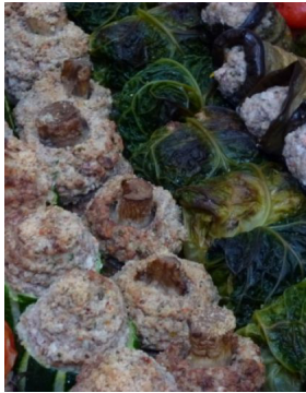
Petits farcis provençaux